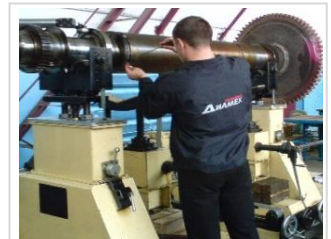
Балансувальний верстат BM-8000 Об'єкт оснащення ДК «Укртрансгаз»

✓ Для організації якісного вхідного контролю підшипників кочення використовується СТЕНД ВХІДНОГО КОНТРОЛЮ ПІДШИПНИКІВ КОЧЕННЯ. Використання стенду дозволить виключити використання неякісних підшипників в процесі виготовлення та ремонту, а також аргументовано пред'являти претензії та повертати неякісну продукцію постачальнику.