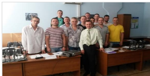
Випускники навчальних курсів «Вібродіагностика».

Навчальний процес включає в себе як теоретичні так і практичні заняття. Учбові міста обладнані комп'ютерами, вибровимірною апаратурою, учбово-демонстраційними стендами для моделювання різних дефектів роторного обладнання. В учбовому залі встановлено зразки балансувальних верстатів. Викладання проводять досвідчені фахівці ТОВ «ДІАМЕХ-УКРАЇНА» II та III рівня кваліфікації з великим практичним та теоретичним досвідом в вібраційній діагностиці обладнання. Фахівці ТОВ «ДІАМЕХ-УКРАЇНА» також проводять виїзне навчання по роботі з вибровимірною апаратурою та балансувальними верстатами на місці їх встановлення, безпосередньо у Замовника.