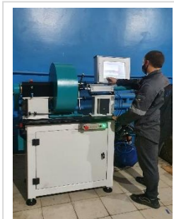
Стенд вхідного контролю підшипників кочення СП-180М

✓ В процесі виконання ремонту роторного обладнання, важливою складовою якісного ремонту є виконання високоточного балансування роторів на БАЛАНСУВАЛЬНОМУ ВЕРСТАТІ. ТОВ «ДІАМЕХ-УКРАЇНА» пропонує широку лінійку балансувальних верстатів для балансування роторів різної конфігурації, з горизонтальною та вертикальною віссю обертання. Понад 30 одиниць балансувальних верстатів впроваджених фахівцями ТОВ «ДІАМЕХ-УКРАЇНА» експлуатуються на підприємствах України.