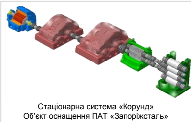
Стационарна система «Корунд» Об'єкт оснащення ПАТ «Запоріжсталь»

вібрації - ВІБРОМЕТРИ, АНАЛІЗАТОРИ ВІБРАЦІЇ, БАЛАНСУВАЛЬНІ ПРИЛАДИ. На підприємства України поставлено понад 400 одиниць.